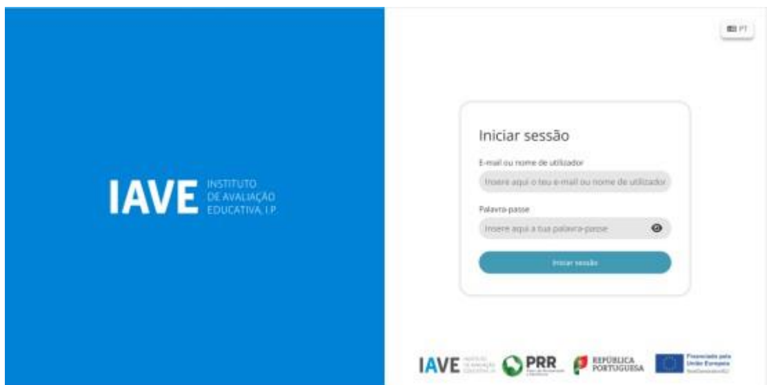
Figura 1 - Acesso à Plataforma de Realização das Provas Eletrónicas do IAVE

(Obs.: Para as escolas que optaram pelo offline em rede ou standalone , os procedimentos para acederem à Plataforma de Realização das Provas Eletrónicas do IAVE irão ser oportunamente divulgados)