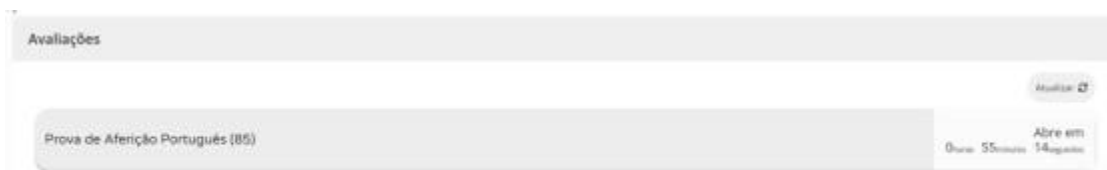
Figura 2 - Acesso à prova a realizar

5.8. Nas restantes provas ao clicar em “Iniciar sessão”, por exemplo, para um aluno que realiza a prova de aferição de Português (85), aparece o seguinte ecrã: